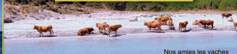
Nos amies les vaches

• Adulte : 29 € • Enfant de 4 à 11 ans : 17 € • Enfant - de 4 ans : Gratuit