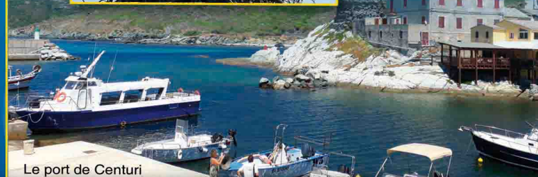
Le port de Centuri

• Adulte : 40 € • Enfant de 4 à 11 ans : 27 € • Enfant - de 4 ans : Gratuit