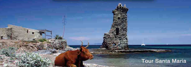
Tour Santa Maria

• Adulte : 25 € • Enfant de 4 à 11 ans : 15 € • Enfant - de 4 ans : Gratuit