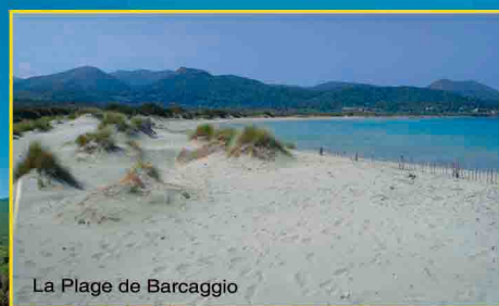
La Plage de Barcaggio

• Départs à 11h et 14h tous les jours. Départ supplémentaire à 9h du 1 er août au 20 août • Retour de Barcaggio au choix : soit à 15h15 avec une arrivée à Macinaggio à 16h soit à 17h30 avec une arrivée à Macinaggio à 18h15 Retour supplémentaire à 12h du 1 er août au 20 août arrivée à Macinaggio à 13h